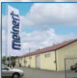
Produkcja w Polsce