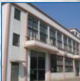
Partner w Chinach

Meinert Signaltechnik GmbH Karlsbader Strasse 8 73760 Ostfildern