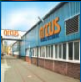
Produktion in Herborn