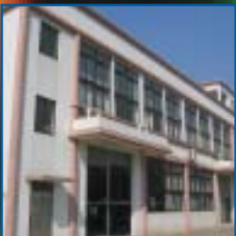
Partner in China

Arcus Kabeltechnik GmbH Karlsbader Strasse 8 73760 Ostfildern