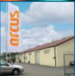
Produktion in Polen