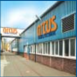
Produktion in Herborn